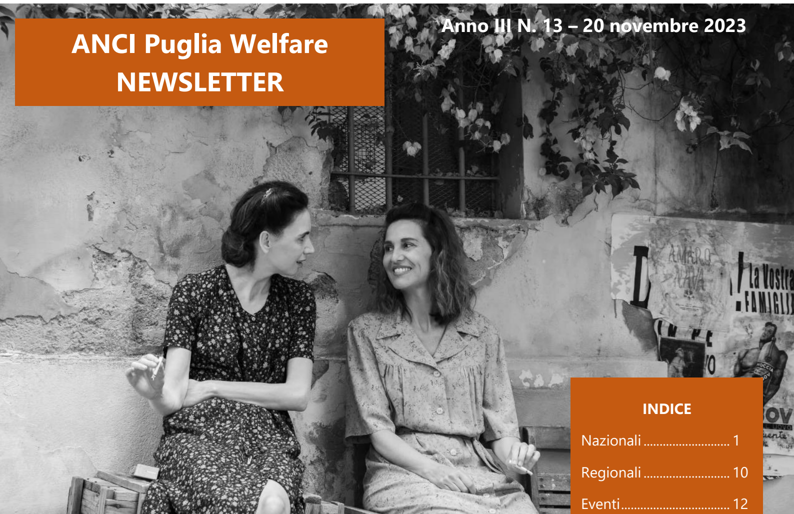
L'immagine del banner è tratta da "C'è ancora domani", film del 2023 diretto da Paola Cortellesi